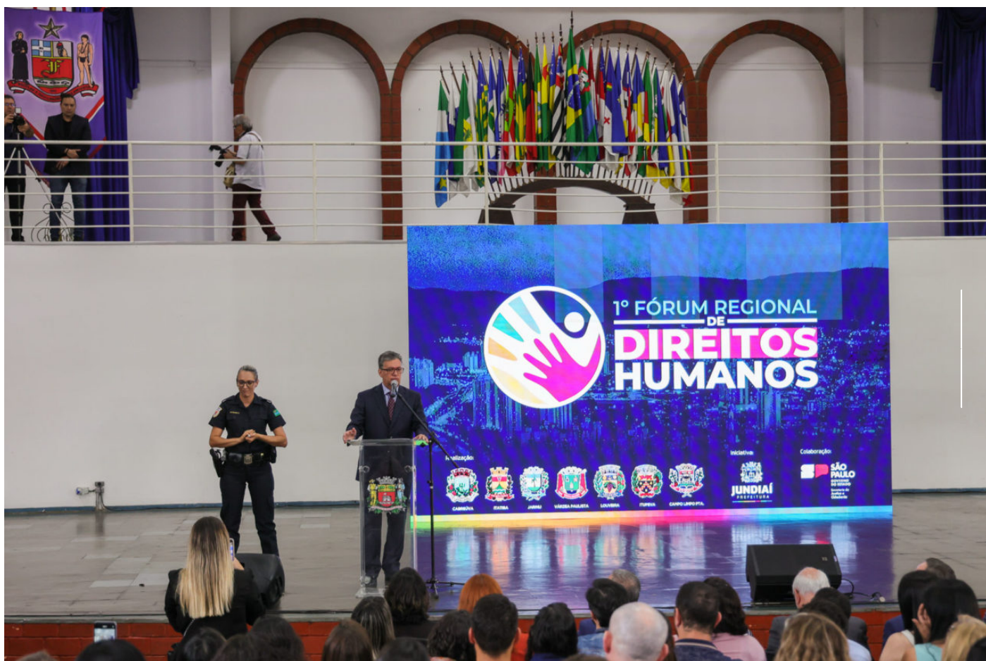
Secretário de Estado de Justiça e Cidadania, Dr Fábio Prieto palestrou no evento

O Fórum teve como finalidade o fomento da discussão qualificada dos direitos humanos e da dignidade da pessoa humana levando em conta sua integralidade, buscando subsidiar o desenvolvimento de políticas públicas na área, com potencial de abrangência à toda a Região Metropolitana de Jundiáí (RMJ), considerando nas discussões e proposições temáticas a realidade, aplicabilidade e autonomia de cada Município.